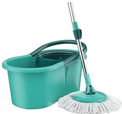
Imagem meramente ilustrativa. Prevalecem as especificações técnicas descritas.

Material: Fio De Algodão De Alta Qualidade