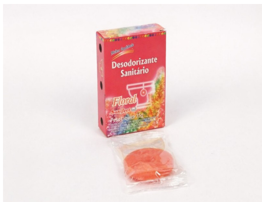
Imagem meramente ilustrativa. Prevaecem as especificações técnicas descritas.