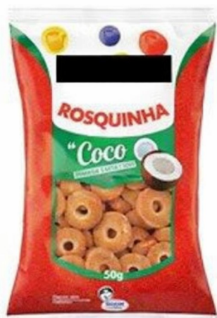
Imagem meramente ilustrativa. Prevalecem as especificações técnicas descritas.