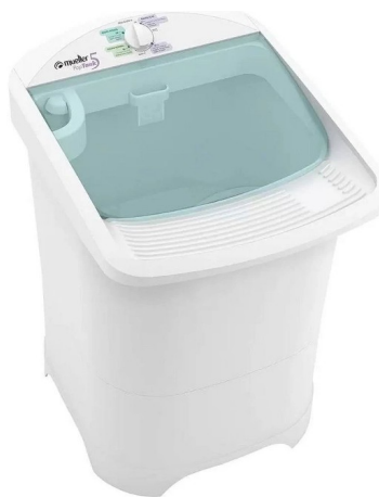
Imagem meramente ilustrativa. Prevalecem as especificações técnicas descritas.