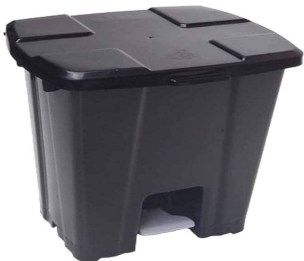
Imagem meramente ilustrativa. Prevalecem as especificações técnicas descritas.