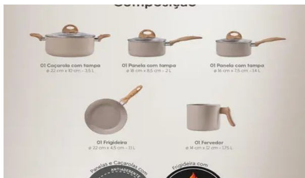
Imagem meramente ilustrativa. Prevalecem as especificações técnicas descritas.