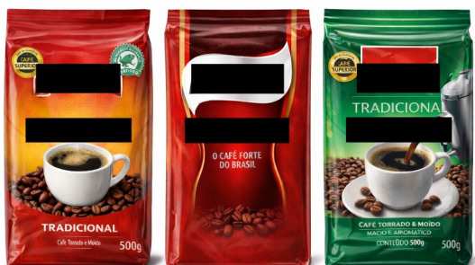
Imagem meramente ilustrativa. Prevalecem as especificações técnicas descritas.