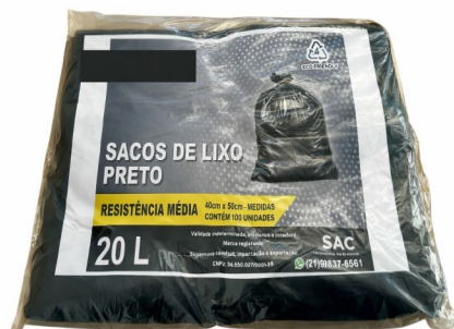
Imagem meramente ilustrativa. Prevalecem as especificações técnicas descritas.