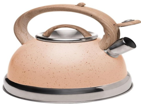
Imagem meramente ilustrativa. Prevalecem as especificações técnicas descritas.