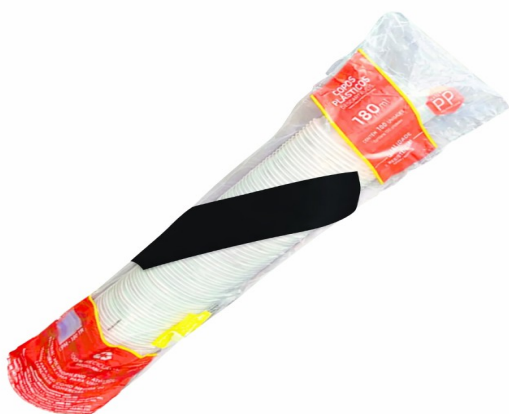
Imagem meramente ilustrativa. Prevalecem as especificações técnicas descritas.