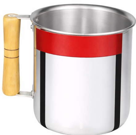
Imagem meramente ilustrativa. Prevalecem as especificações técnicas descritas.