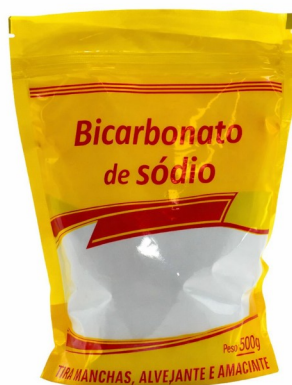
Imagem meramente ilustrativa. Prevalecem as especificações técnicas descritas.

Descrição: Bicarbonato de sódio em pó, de uso geral para limpeza.