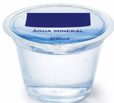
Imagem meramente ilustrativa. Prevalecem as especificações técnicas descritas.