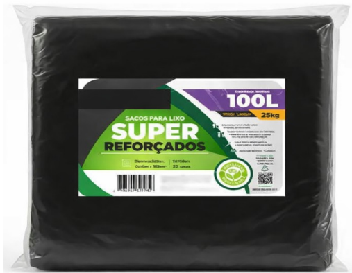
Imagem meramente ilustrativa. Prevalecem as especificações técnicas descritas.