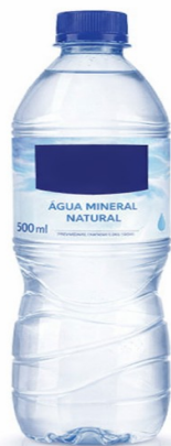
Imagem meramente ilustrativa. Prevalecem as especificações técnicas descritas.