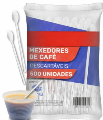
Imagem meramente ilustrativa. Prevalecem as especificações técnicas descritas.