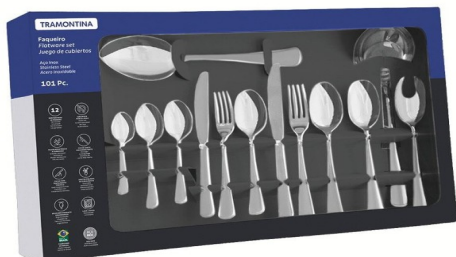
Imagem meramente ilustrativa. Prevalecem as especificações técnicas descritas.