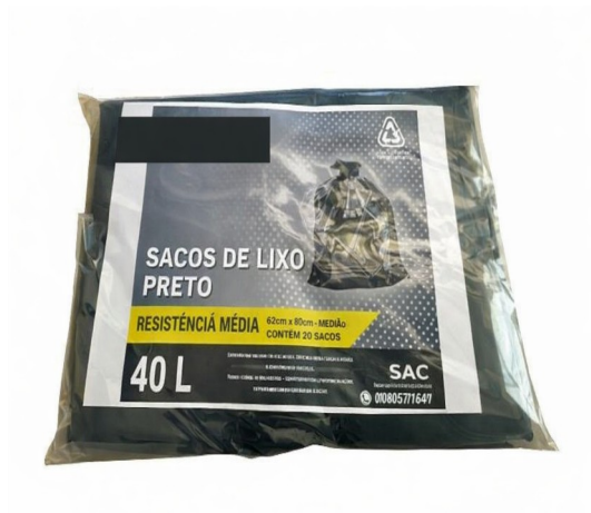
Imagem meramente ilustrativa. Prevalecem as especificações técnicas descritas.