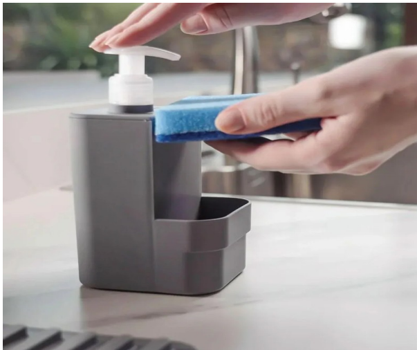
Imagem meramente ilustrativa. Prevalecem as especificações técnicas descritas.