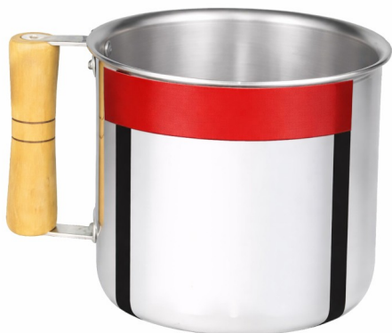
Imagem meramente ilustrativa. Prevalecem as especificações técnicas descritas.