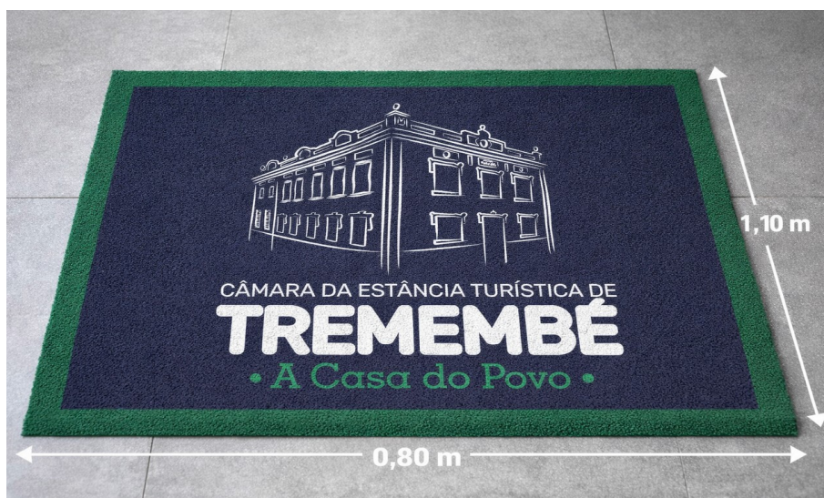
Imagem meramente ilustrativa. Prevaecem as especificações técnicas descritas.