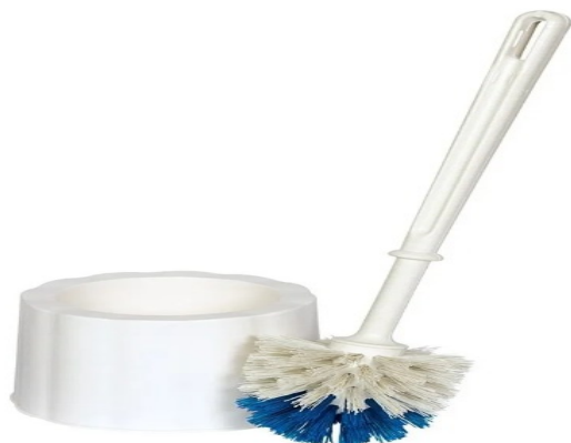
Imagem meramente ilustrativa. Prevalecem as especificações técnicas descritas.